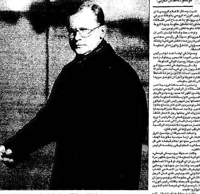
موسكو - بالقدس العربي